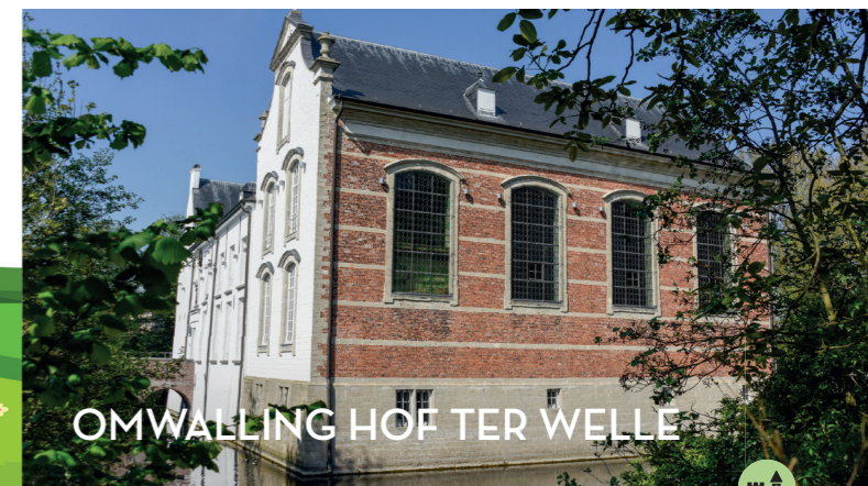
OMWALLING HOF TER WELLE

De eendjes om en rond de omwalling van Hof Ter Welle zijn ongetwijfeld een vaste waarde geworden voor alle wandelaars, passanten en bezoekers van deze site. Maar er is nóg meer dierenplezier op komst op deze mooie route... Via het project 'Buurten op den buiten' werkt men vanuit tehuis Hof Ter Welle momenteel aan 'Kinderboerderij Ter Welle': een buurt-verbindend project. Vanaf het najaar 2022 kan ook de toevallige passant de kinderboerderij bezoeken. Iets om ongetwijfeld naar uit te kijken dus!