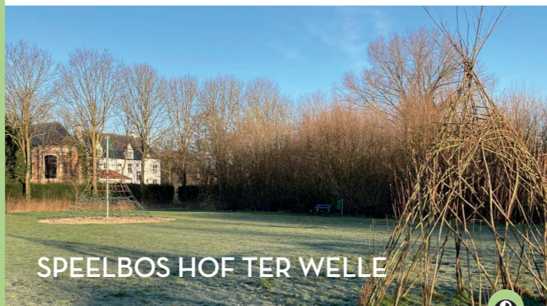
SPEELBOS HOF TER WELLE

Deze wandelroute kwam tot stand binnen het 10.000 stappen project en werd speciaal ontwikkeld met het oog op toegankelijkheid. In samenspraak met de voorzieningen uit de buurt werd gekozen om de focus te leggen op beleving; een korte, maar sprekende cirkelwandeling die jong en oud motiveert om in beweging te komen en te genieten van de mooie omgeving die Beveren te bieden heeft. Speciaal voor de lancering van deze wandelroute werden extra rustbanken en 2 toegankelijke picknickplaatsen met ruimte voor rolstoelgebruikers geplaatst.