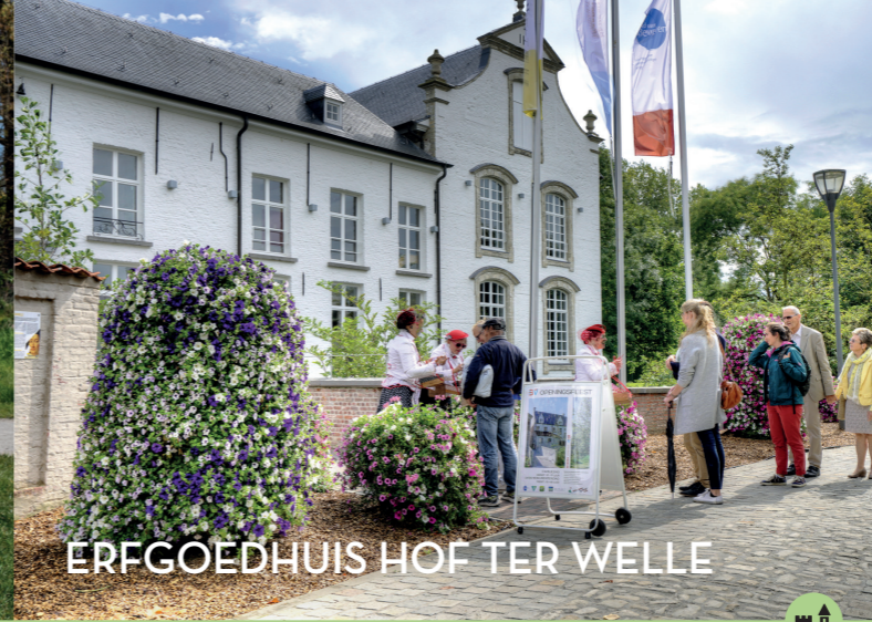
ERFGOEDHUIS HOF TER WELLE

In 2010 werd een geboortebos aangeplant voor alle Beverse kinderen geboren of geadopteerd in 2009. Het was de eerste stap in de ontwikkeling van een 1,5 hectare groot speelbos voor jong en oud. Met dit initiatief wilde men aanknopen met een eeuwenoude traditie: de geboorte van een kind vieren met het planten van een boom. Op deze groene plek kan men genieten van natuur en rust. De uitgelezen plek voor iedereen om te vertoeven!