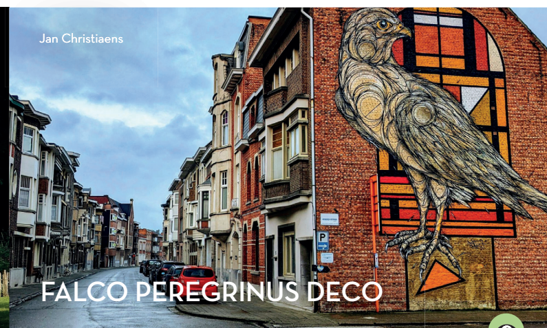
FALCO PEREGRINUS DECO

De kiosk in het Romain De Vidtpark is de enige in zijn soort die nog bestaat. Het is een sierlijke gietijzeren constructie in eclectische stijl, met Moorse en neogotische invloeden. De muziekkiosk werd in 1860 gebouwd en stond toen op de Grote Markt, maar moest in de jaren '80 wijken voor de aanleg van een busstation. Hij wordt nog maar zelden als 'podium' gebruikt, maar in de zomermaanden kan je wel terecht op de Parkies, het muziekfestival dat elke dinsdagavond voor sfeer in het park zorgt.