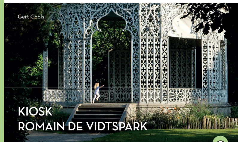
KIOSK ROMAIN DE VIDTPARK

De versieringen rond de deur en vensters getuigen van de art-decostijl. Naast deze inspirerende gevel, vind je in de Kalkstraat nog vele andere art-decopareltjes, zoals de gevel op nr. 8, in de herkenbare stijl van architect August Waterschoot, of de gevelhoge erker met talloze kleine glas-in-loodramen op nr. 62.