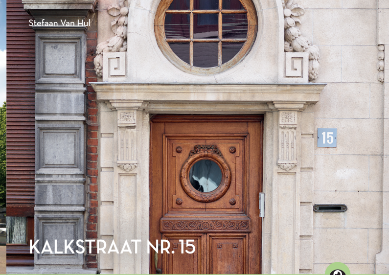
KALKSTRAAT NR. 15