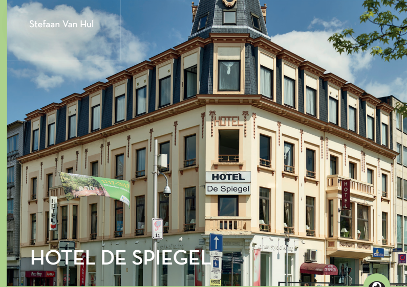
HOTEL DE SPIEGEL