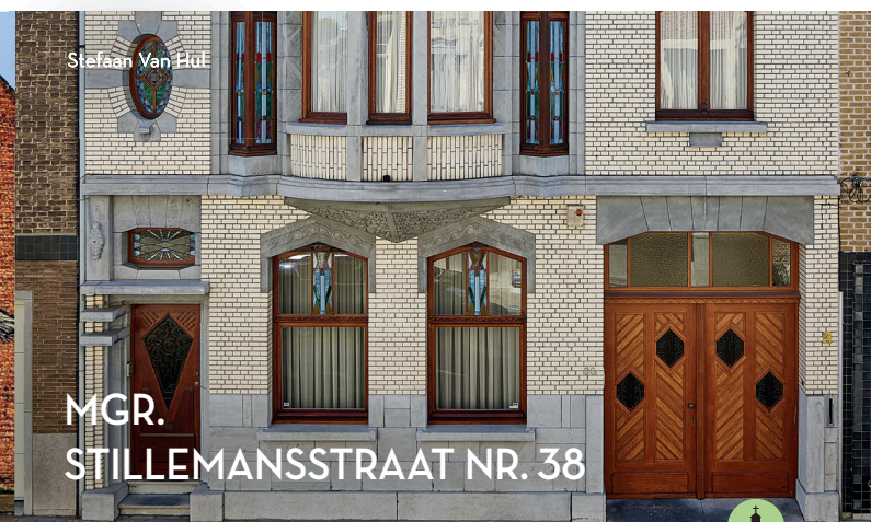
MGR. STILLEMANSSTRAAT NR. 38

De Antwerpse muralist Dzia ontwierp de Falco Peregrinus Deco. Het werk is een knipoog naar het rijke art deco erfgoed in Sint-Niklaas en in de aangrenzende Monseigneur Stillemansstraat. Door de vele prachtige art deco woningen werd deze straat in 2002 beschermd als stadsgezicht. De slechtvalk die wordt afgebeeld verwijst naar het koppel slechtvalken dat sinds een aantal jaar in een nestkast op de toren van de Onze-Lieve-Vrouwekerk nestelt. Ze hebben zelfs hun eigen webcam!