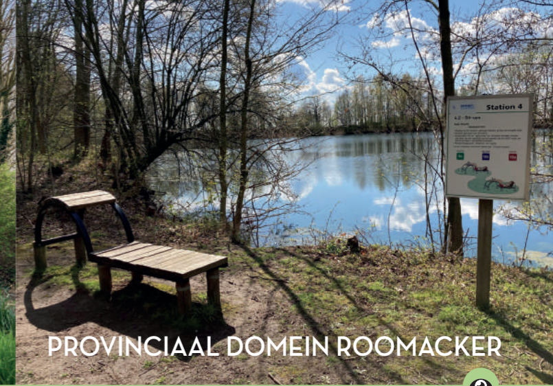
PROVINCIAAL DOMEIN ROOMACKER

Dit uniek stukje aangeplant bos bevat een grote variëteit aan eiken (zo'n 130 verschillende soorten). De oorspronkelijke eigenaars waren lid van The International Oak Society en wisselden regelmatig gegevens en zaden van eiken uit over heel de wereld. In 2018 kocht het Lokaal Bestuur van Temse de gronden aan.