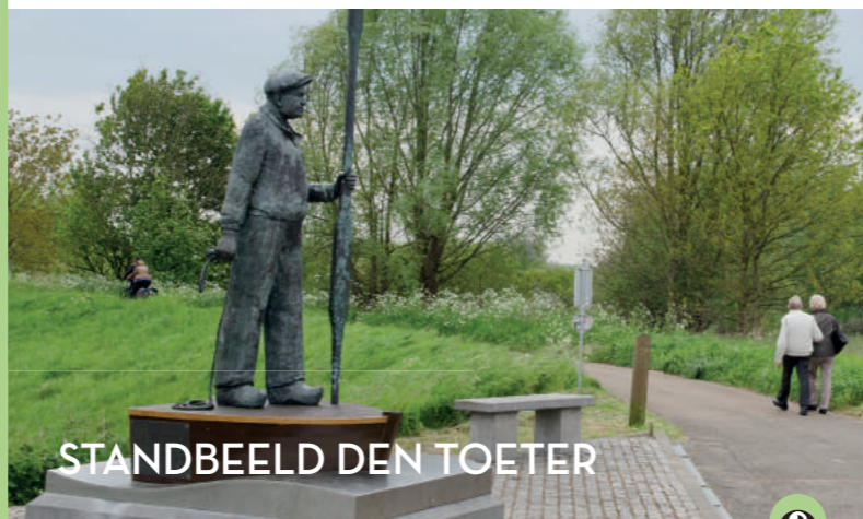
STANDBEELD DEN TOETER

In Provinciaal Domein Roomacker liggen 3 vijvers of putten, overblijfselen van de kleiwinning door de Antwerpse Machinesteenbakkerijen (1930-1942). De site groeide uit tot een uniek natuurgebied met waardevolle fauna en flora. In 1993 werd het aangekocht door de Provincie Oost-Vlaanderen, die het samen met het gemeentebestuur belevingsvol en met respect voor de natuur hebben ingericht met infoborden, rustbanken, insectenhotel, Finse piste en fit-o-meter. De naam Roomacker verwijst naar de oorspronkelijke eigenaars van deze gronden, nl. de 16 de -eeuwse familie Van Roome.