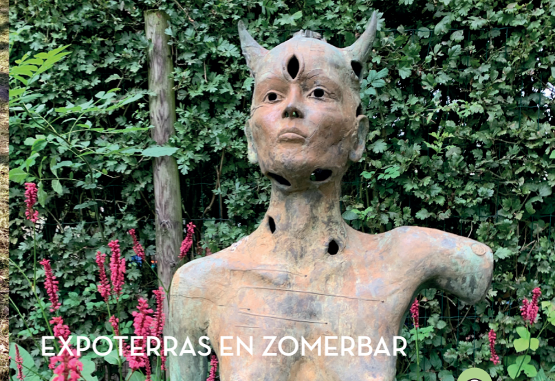
EXPOTERRAS EN ZOMERBAR

De 'Zwarte Ruiter' is de vroegere benaming van het gehucht 'Ruiter' in de gemeente Waasmunster. De wijk wordt begrensd door de Oudeheerweg-Ruiter (de voormalige Hoge Heerweg Gent-Antwerpen), en de Neerstraat of Lage Heerweg. De Sousbeekstraat is de hoofdweg van de wijk. 'Zwarte Ruiter' verwijst naar de gelijknamige herberg die destijds (gaat terug tot 1734) aan het kruispunt met de Oudeheerweg was gelegen. De herberg ontleende dan weer zijn naam aan de lokale legende over de moordzuchtige bendeleider te paard die de streek teisterde.