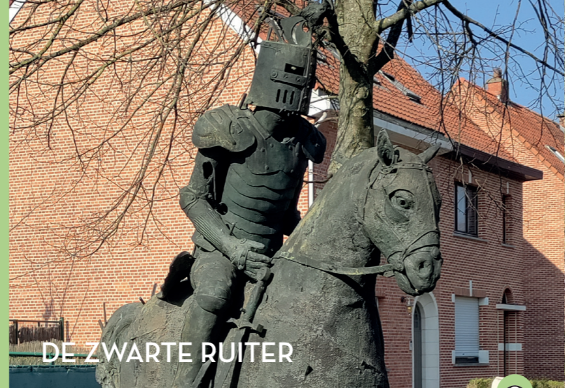
DE ZWARTE RUITER

Ga je liever op stap met de smartphone? Scan de QR-code om de route digitaal te raadplegen.