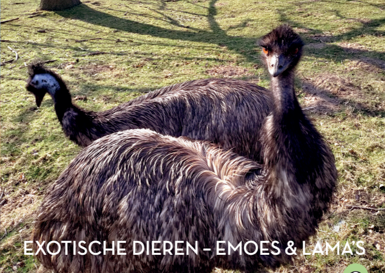
EXOTISCHE DIEREN - EMOES & LAMA'S